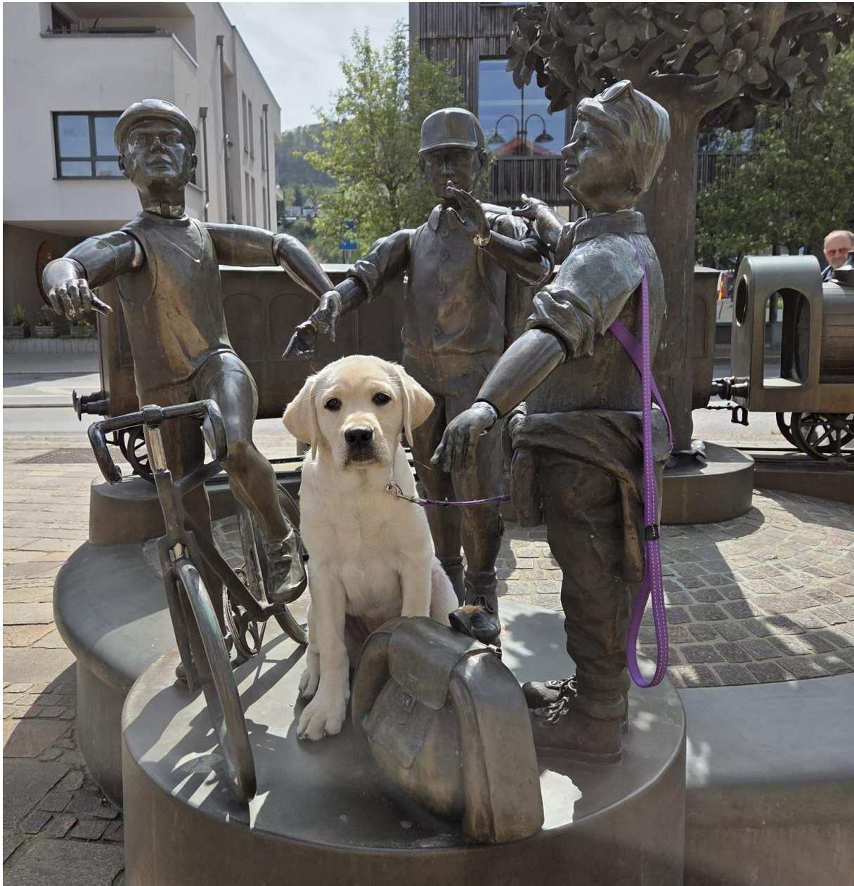
Groetjes van Sapper!

In het volgende verslag vertellen we meer over de belevenissen van Sapper in het puppypleeggezin.