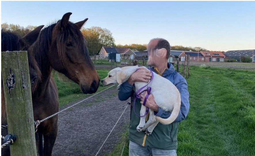
Veilig kennismaken met wel heel grote viervoeters!