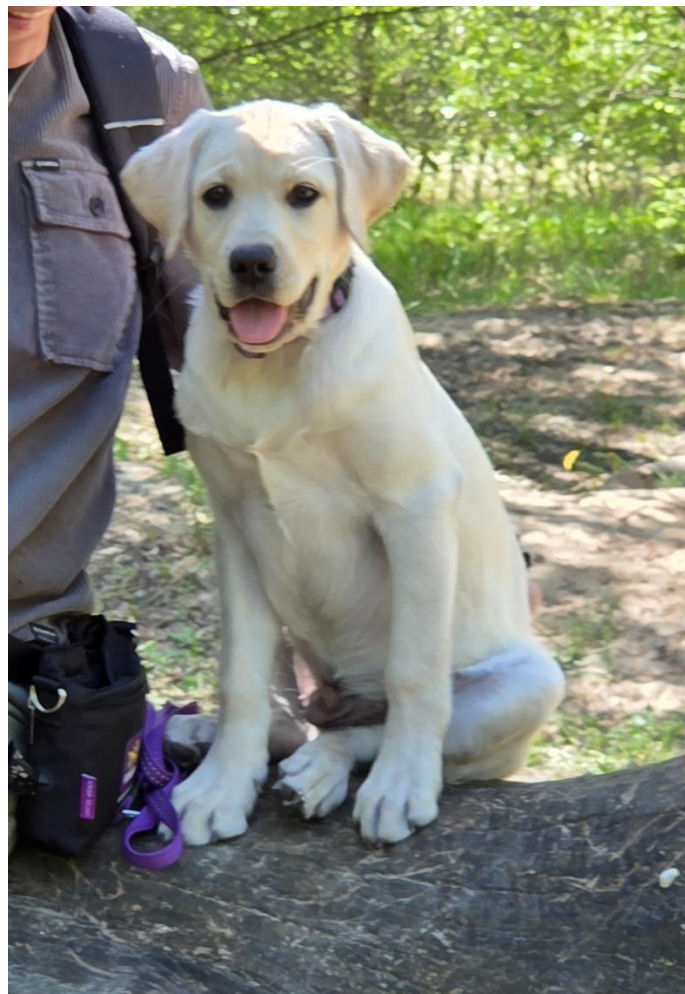
Sapper groeit als kool

'Sapper is nu bijna vijf maanden en komt elke week ongeveer één kilo aan. De hoeveelheid voer hebben we wel opgehoogd om te zorgen dat hij niet te mager wordt. Hij krijgt nu nog vier keer per dag eten, maar zal straks, als de instructrice is geweest, wel overgaan naar drie keer per dag.'