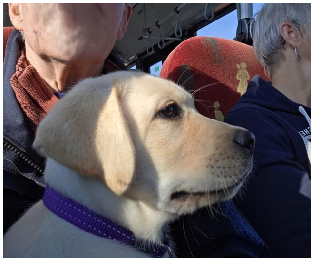
Op schoot was de busrit niet eng...

‘Zoals al aangegeven heeft Sapper de afgelopen maanden de nodige indrukken opgedaan. We hebben een kort ritje met een stadsbus gemaakt. Sapper hebben we op schoot genomen omdat hij het allemaal maar spannend vond. We zijn voor een paar dagen met de camper weggeweest. Sapper heeft tijdens de korte reis lekker tussen de voorstoelen liggen slapen. Op de camperplaats was het erg rustig en heeft Sapper daar lekker los kunnen lopen. Als een jong hert in de wei was hij aan het rondspringen. Dit keer maakten we een wandeling van drie kwartier met de hondenkar. Op het laatst liet hij wel horen dat het genoeg was.’