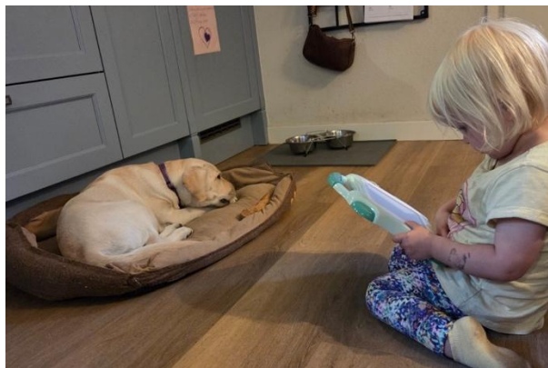
Als ze rustig een boekje leest, vindt Sapper haar wel leuk...;-)

‘Voor het eerst gingen we met Sapper een paar dagen naar de kleinkinderen. De aankomst vond Sapper erg spannend: nieuwe gezichten, een andere omgeving en drie gillende en schreeuwende kleinkinderen. ’s Avonds, nadat de kleinkinderen op bed lagen, hebben we Sapper rustig de omgeving laten verkennen. De volgende ochtend bleef Sapper rustig, liet hij zich aaien en ging hij spelen met de kinderen. Beide partijen genoten daarvan.’