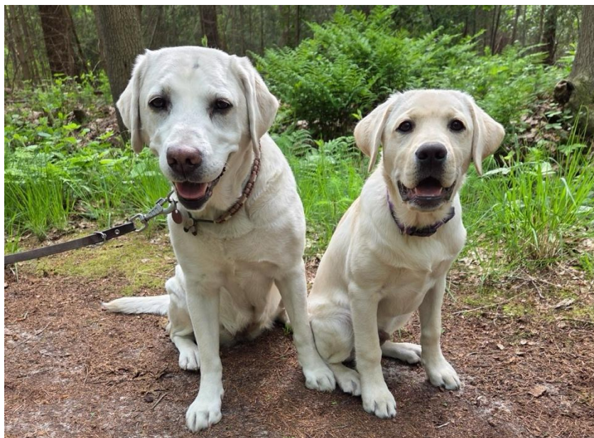
Taime en Sapper (r)

‘Om Gonja rustig van haar pasgeboren pups te laten genieten, hebben wij twee weken Taime in huis gehad. Sapper was blij en sloofde zich meerdere keren uit om indruk te maken. Hij ging over Taime heen staan als zij lag te rusten, beet zachtjes in haar oren, ging voor haar liggen rollen en probeerde haar uit te dagen voor een spelletje. Waar Taime ging liggen, ging Sapper ook liggen. Het is ook een klein jaloers mannetje. Als Taime werd aangehaald, wrong hij zich ertussen om ook aangehaald te worden. Volgens mij hebben ze ook een keer woorden gehad, want Sapper durfde die dag niet bij Taime te gaan liggen. De volgende dag hadden ze het gelukkig weer goed gemaakt.’